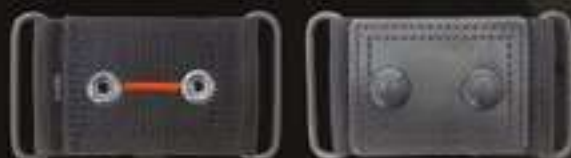
KIT EXTRA SAFE #9300SK