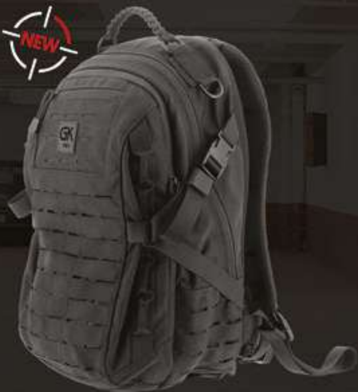
TROOPER 35L #96301