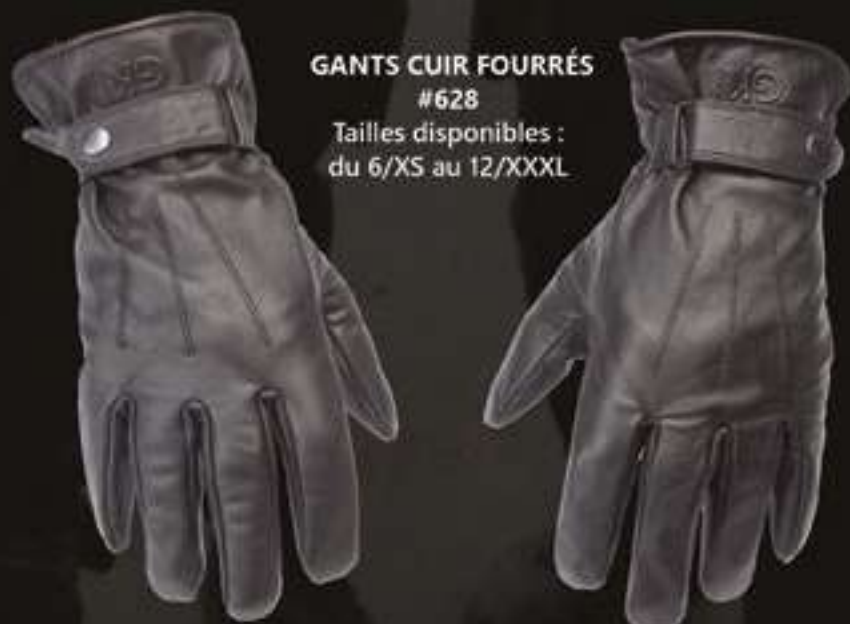
GANTS CUIR FOURRÉS #628

Tailles disponibles : du 6/XS au 12/XXXL