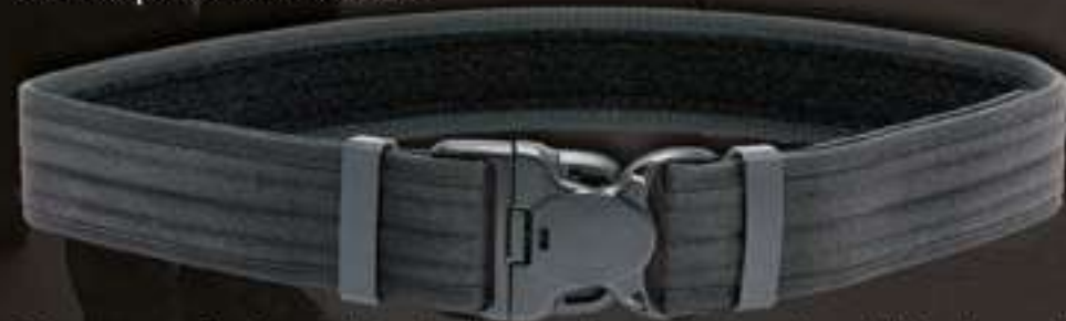
CEINTURON AVEC BOUCLE DE SÉCURITÉ #9305

Ceinturon XT40 aspect cuir avec insert basket weave - 50 mm de large - Extrêmement résistant - Facile à entretenir - Confortable à porter et suffisamment rigide pour éviter les phénomènes de torsion - Doublé de ruban auto-agrippant velours pour améliorer le maintien de la sous-ceinture #93401 - Boucle de sécurité 3 points Tailles disponibles : du S au 2XL