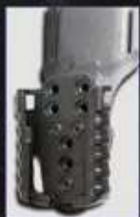
MODULE RÉCEPTACLE KX2 #880KX2-02