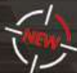
CEINTURON D'INTERVENTION BOUCLE BREVETÉE #4852

Boucle de sécurité auto-bloquante brevetée - Système de fermeture sécurisé et rapide auto-ajustable - 50 mm de large - Doublé de ruban auto-agrippant velours pour améliorer le maintien de la sous-ceinture #93401 - Conçu pour ne pas subir d'effet de torsion dû au poids des différents accessoires et étui portés - Aspect cuir et cordura Tailles disponibles : du S au 3XL