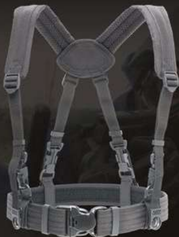
BRELAGE DE SOUTIEN #92403