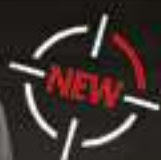
TROOPER 25L #96300