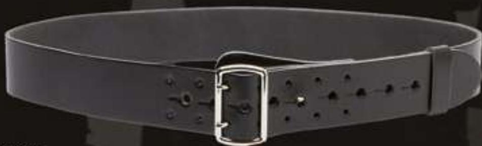
CEINTURON 45 MM PROFESSIONNEL CUIR #302

Ceinturon largeur 50 mm multitailles en sangle semi-rigide - Extrêmement résistant - Intérieur doublé d'auto-agrippant velours - Retours doublés d'auto-agrippant crochet pour permettre le réglage en fonction de sa taille - Fermeture par boucle rapide