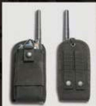
PORTE-RADIO UNIVERSEL M.O.L.L.E #9441