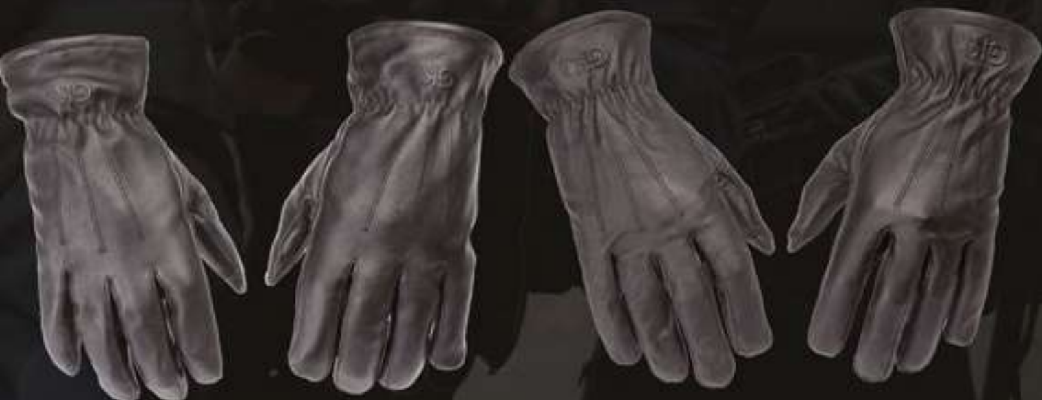
GANTS CUIR ANTI-COUPURE LEVEL 5 - CE : EN 388 - EN420 #625