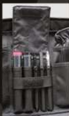
PATROL BAG 35L # 9628