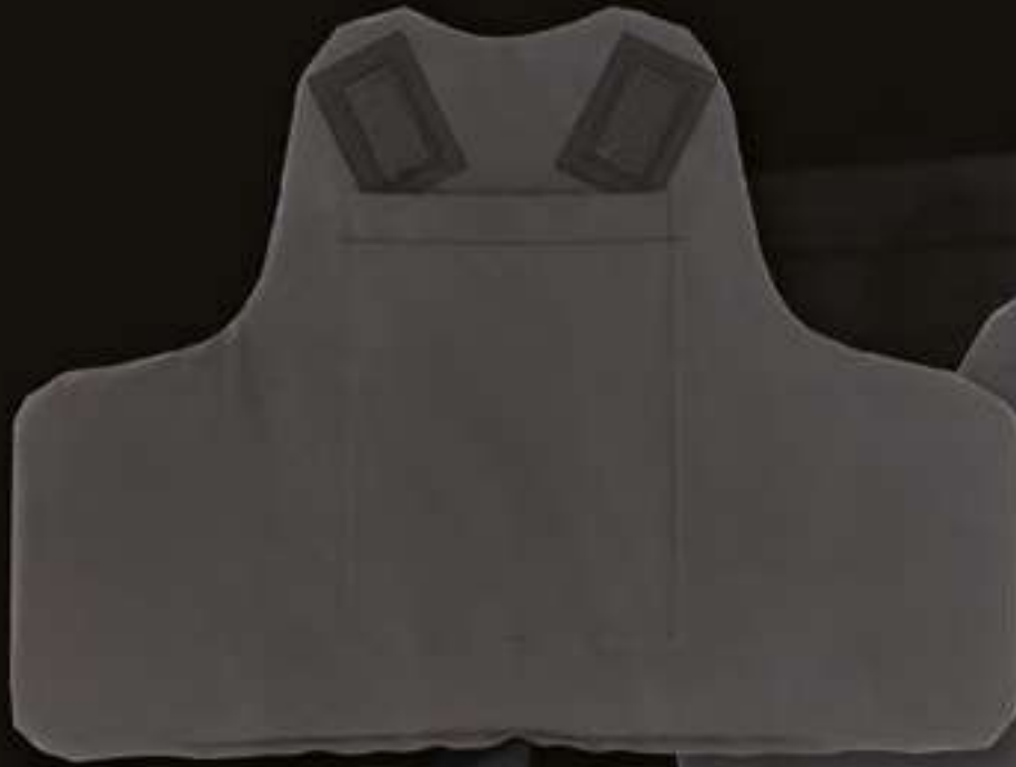
PACK BALISTIQUE AVANT/FRONTAL