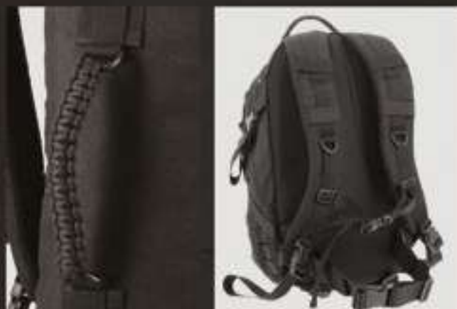
TROOPER 60L #96302