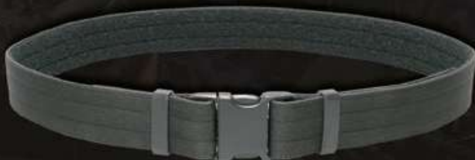
CEINTURON POLICE TACTICAL - RED LABEL #9302

Ceinturon largeur 50 mm multitailles en polyamide - Bordé pour offrir une meilleure longévité à la ceinture - Triple couture pour une meilleure résistance - Bord intérieur doublé d'auto-agrippant velours - Retours doublés d'auto-agrippants crochets pour permettre le réglage en fonction de sa taille - Fermeture par boucle rapide