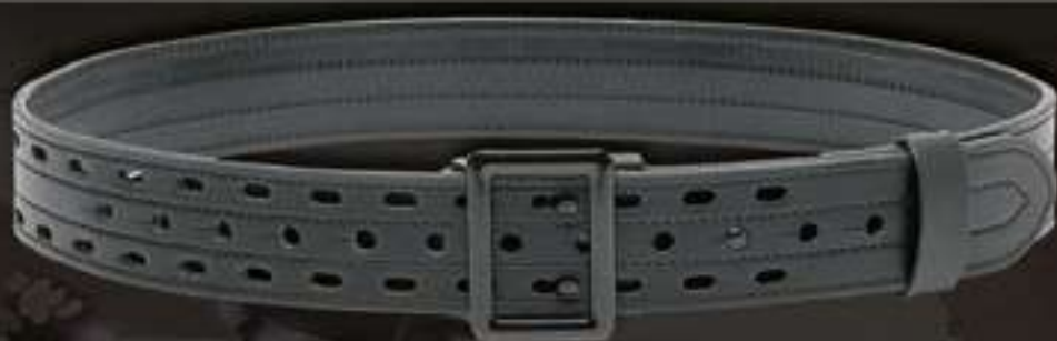
CEINTURON D'INTERVENTION BOUCLE BREVETÉE #4850

Boucle de sécurité auto-bloquante brevetée - Modernité et sécurité - Aspect cuir - Système de fermeture sécurisé et rapide auto-ajustable - 50 mm de large - Conçu pour ne pas subir d'effet de torsion dû au poids des différents accessoires et étuis portés - Tailles disponibles : du S au 3XL