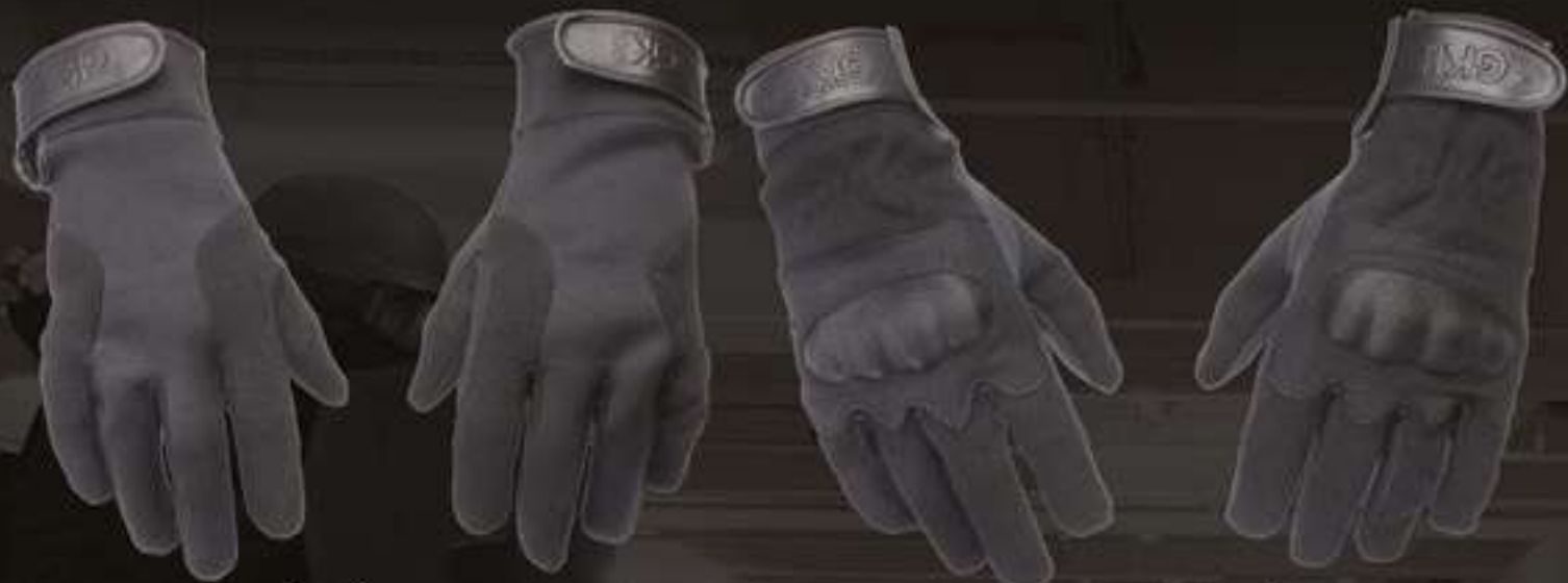
GANTS NÉOPRÈNE "BLACK SKIN"