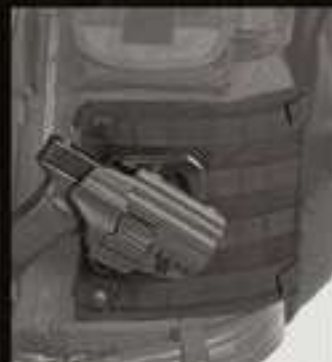
PAD AMOVIBLE POUR CHASUBLE #97920-PAD