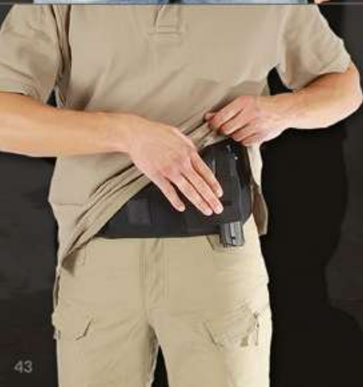
HIDDEN BELT # 9621