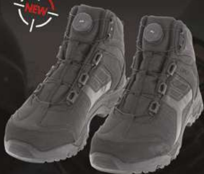
SPEED LACE SHOES #10SL