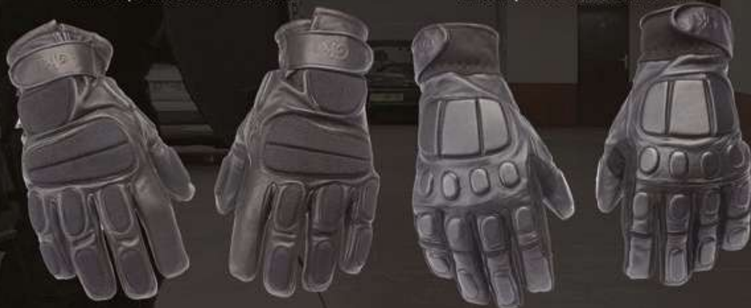
GANTS INTERVENTION ANTI-COUPURE