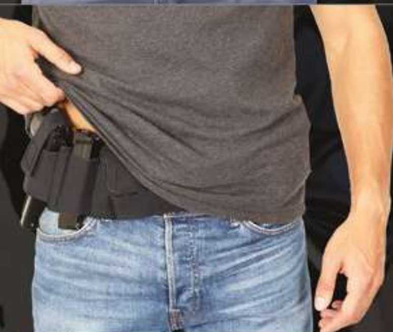
NEO BELT # 96380