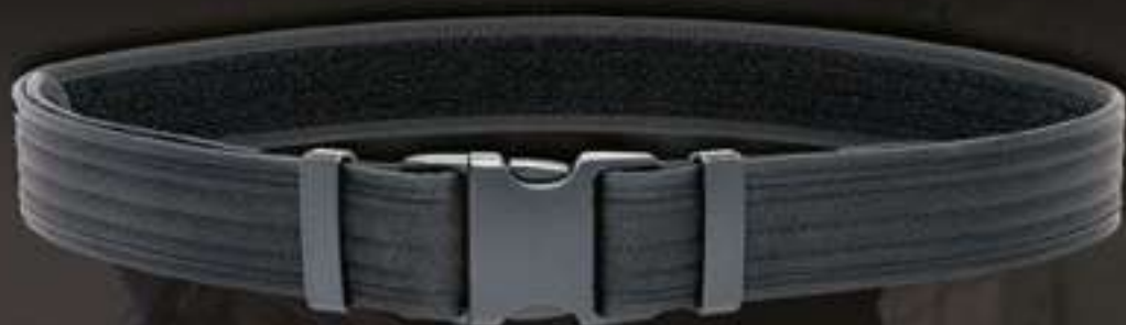
CEINTURON POLICE - MULTITAILLES #9303

Ceinturon largeur 50 mm multitailles en polyamide - Bordé pour offrir une meilleure longévité à la ceinture - Triple couture pour une meilleure résistance - Bord intérieur doublé d'auto-agrippant velours - Retours doublés d'auto-agrippants crochets pour permettre le réglage en fonction de sa taille - Fermeture par boucle rapide