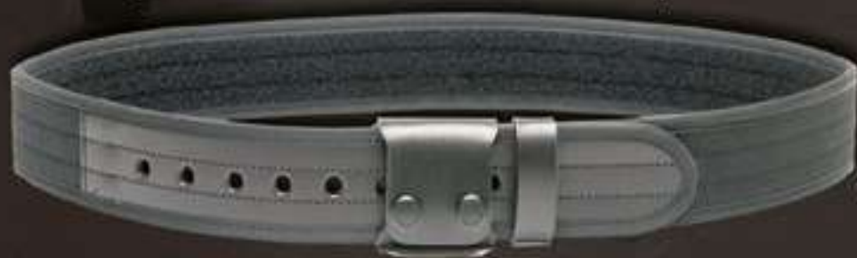
CEINTURON TIMECOP GENDARMERIE #9350

Ceinturon renforcé pour éviter la déformation générée par le poids de l'ensemble des accessoires portés et de l'arme - 50 mm de large - Cordura - Boucle de sécurité 3 points - Intérieur doublé d'auto-agrippant velours permettant une association parfaite avec la sous-ceinture #93401 - Tailles disponibles : du S au 6XL