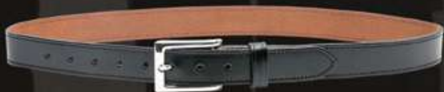
CEINTURE LUXE 30 MM CUIR DOUBLE #303

Ceinturon largeur 45 mm - Ultra résistant - Boucle double ardillons plus un bouton à gorge permettant de garantir une fermeture du ceinturon totalement sécurisée - 100% cuir véritable Tailles disponibles : T1 à T6