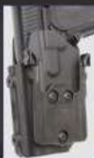
MODULE SUPPORT KX2 #880KX2-01