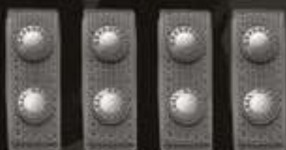
SET DE 4 BELKEEPERS RED LABEL #9340BK-1