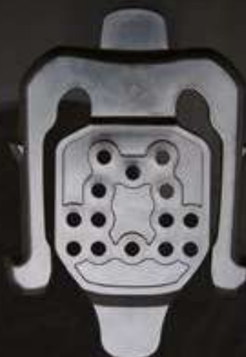
MODULE RÉCEPTACLE KX2 SYSTÈME M.O.L.L.E #880KX2-03