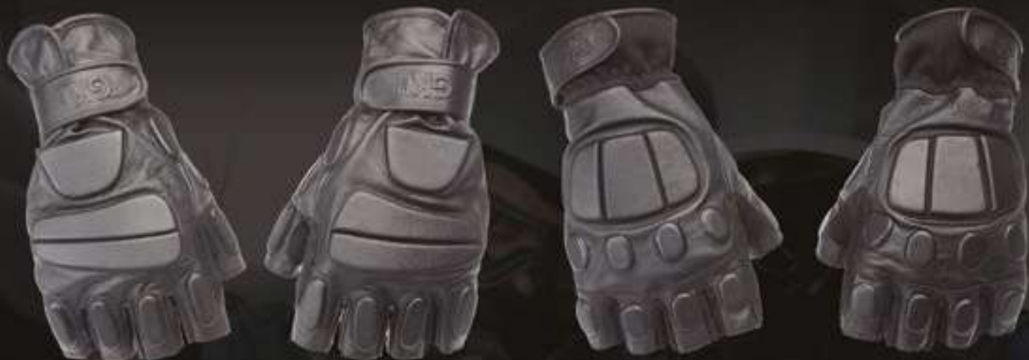
MITAINES NÉOPRÈNE 1/2 DOIGT #BLK761