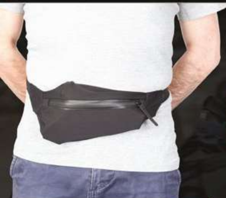
SLIM BELT # 96381