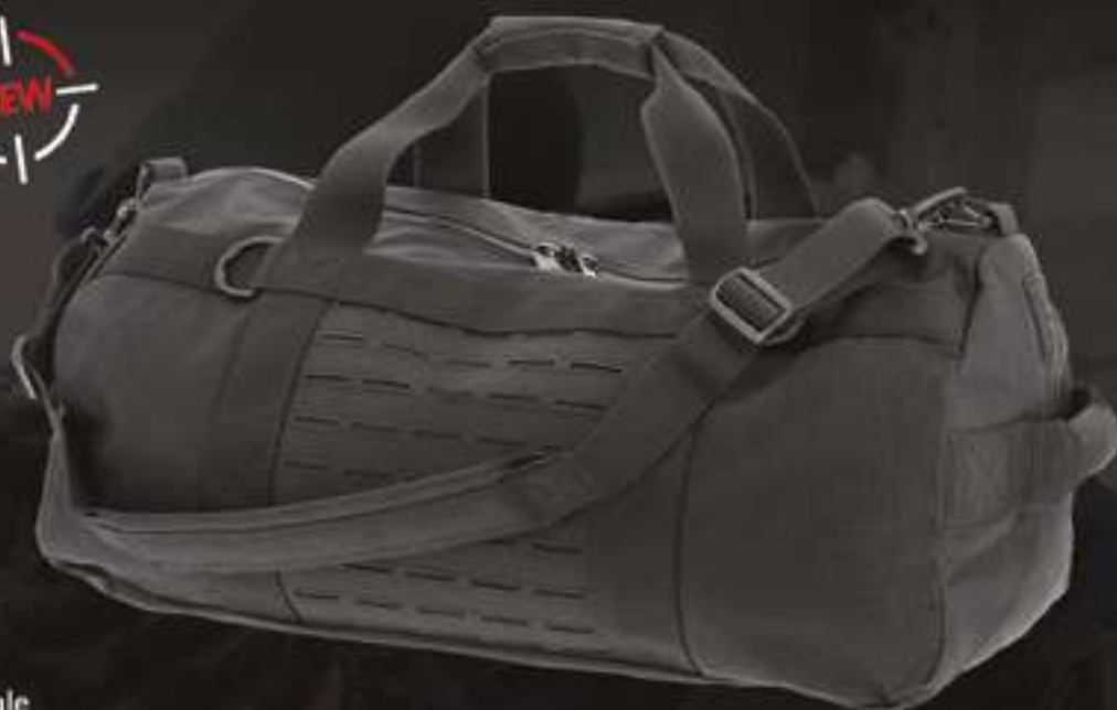
TASK FORCE 60L #9623