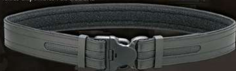
CEINTURON D'INTERVENTION XT40 #4805

Boucle de sécurité auto-bloquante brevetée - Système de fermeture sécurisé et rapide auto-ajustable - 50 mm de large - Doublé de ruban auto-agrippant velours pour améliorer le maintien de la sous-ceinture #93401 - Conçu pour ne pas subir d'effet de torsion dû au poids des différents accessoires et étui portés - Aspect cuir et cordura Tailles disponibles : du S au 3XL